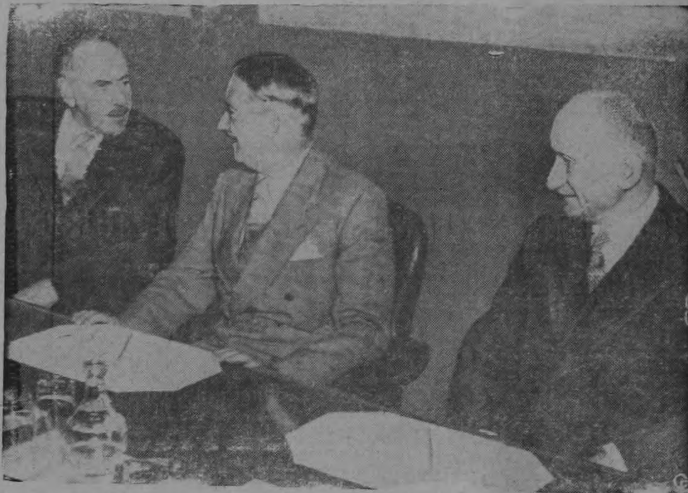
Conferenciando en la capital británica aparecieron, de izquierda a derecha: El Secretario de Estado de los Estados Unidos, Dean Acheson; el Ministro del Exterior de la Gran Bretaña, Anthony Eden, y el Canciller de Francia Robert Schuman. Se reunieron para elaborar una respuesta conjunta a la nota soviética proponiendo una conferencia de cuatro potencias sobre Alemania.