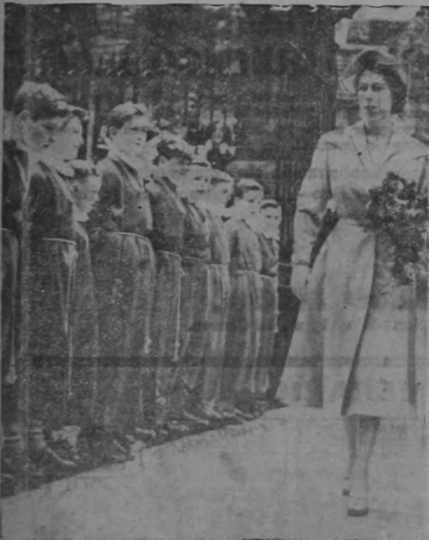
La Reina Isabel II de Inglaterra inspecciona a un grupo de niños en Edimburgo, Escocia. La Reina viajó sola por haber sufrido su esposo un ataque de ictericia.—(INP).